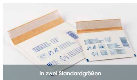
In zwei Standardgrößen

Unsere Luftpolstertasche mit starkem Karton als Außenlage bietet den optimalen Schutz beim Versand Ihrer Datenträger. Ob CD, Speicherkarte oder USB-Stick: Mit diesem Schutz kommen Ihre Daten garantiert sicher an ihr Ziel. Diese Taschen bieten wir Ihnen im Standardsortiment kurzfristig ab Lager – natürlich klimaneutral produziert!