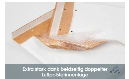
Extra stark dank beidseitig doppelter Luftpolsterinnenlage