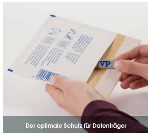
Der optimale Schutz für Datenträger

Die Luftpolsterversandtasche für Ihre Datenträger