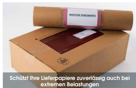
Schützt Ihre Lieferpapiere zuverlässig auch bei extremen Belastungen