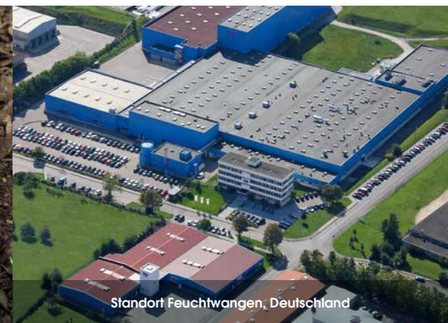
Standort Feuchtwangen, Deutschland