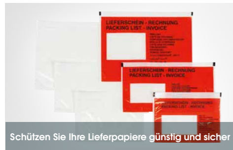
Schützen Sie Ihre Lieferpapiere günstig und sicher

Serienmäßig klimaneutral hergestellt ist die Basic-Variante unserer selbstklebenden Dokumententaschen durch die angepasste Materialzusammenstellung die preisgünstigere Variante zu unserer docuFIX® classic. Trotz dünnerer Folie schützt die Lieferscheintasche zuverlässig Ihre Versandpapiere oder Unterlagen und klebt sicher auf unterschiedlichsten Materialien.