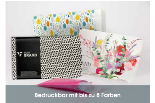
Bedruckbar mit bis zu 8 Farben