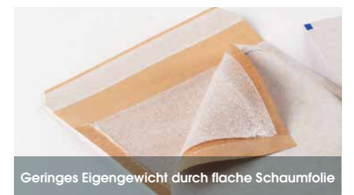
Geringes Eigengewicht durch flache Schaumfolie