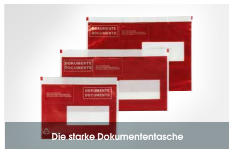
Die starke Dokumententasche

Unsere selbstklebende Dokumententasche in starker Qualität hält auch extremen Belastungen stand und befördert auch mehrseitige oder dicke Unterlagen gut geschützt zusammen mit Ihrer Ware an den gewünschten Zielort.