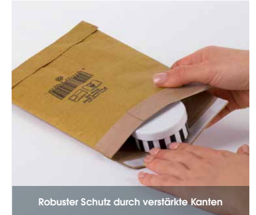
Robuster Schutz durch verstärkte Kanten