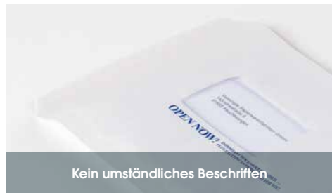
Kein umständliches Beschriften

Mit aroFOL® win, der gepolsterten Alternative mit Sichtfenster, erhalten Sie den gewohnt hohen Schutz unserer bewährten Luftpolsterversandtaschen – aber ganz ohne Adressaufkleber und umständliches Beschriften! Auch diese Variante hat den praktischen Trifixverschluss und unsere schützende Luftpolsterfolie als Innenlage.