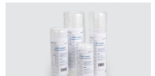
aroFOL® bubble Kleinrollen – die attraktive Verkaufsverpackung