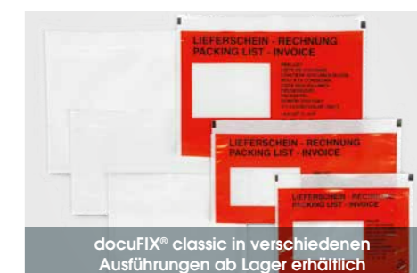
docuFIX® classic in verschiedenen Ausführungen ab Lager erhältlich