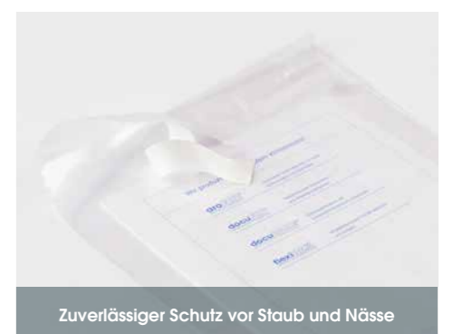
Zuverlässiger Schutz vor Staub und Nässe