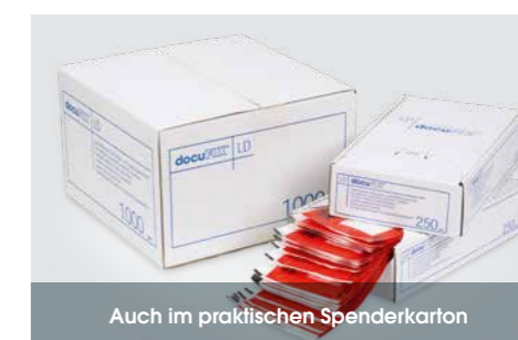
Auch im praktischen Spenderkarton

Viele Standardgrößen und -varianten ab Lager lieferbar. Weitere Standardausführungen finden Sie auf unserer Website.