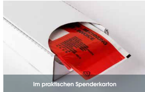
Im praktischen Spenderkarton