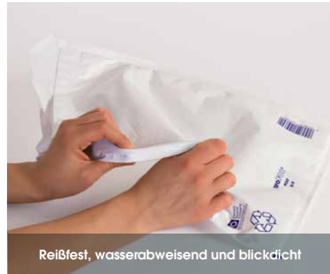
Reißfest, wasserabweisend und blickdicht

Die unverwüstliche Luftpolsterversandtasche