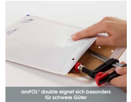
aroFOL® double eignet sich besonders für schwere Güter