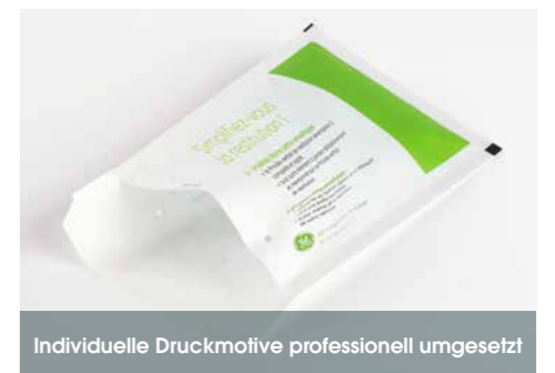
Individuelle Druckmotive professionell umgesetzt