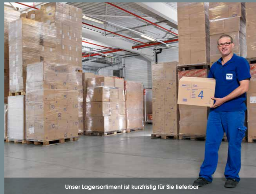
Unser Lagersortiment ist kurzfristig für Sie lieferbar