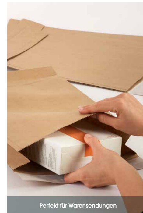
Perfekt für Warensendungen