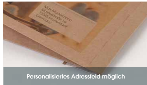
Personalisiertes Adressfeld möglich

Sie möchten Ihr Produkt werbewirksam versenden oder ein personalisiertes Mailing zu einem besonderen Anlass verschicken? Dann sind unsere Papierversandtaschen genau das Richtige für Sie: viele unserer Standardformate fertigen wir für Sie im individuellen Digitaldruck auch in Kleinauflagen (200 bis 2.000 Stück). So hinterlassen Sie Eindruck!