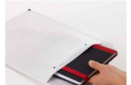
Besonders für den Versand flacher Gegenstände geeignet