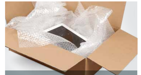
Das perfekte Füllmaterial