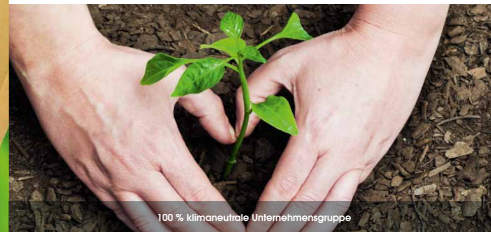
100 % klimaneutrale Unternehmensgruppe