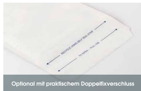
Optional mit praktischem Doppelfixverschluss

Besonderen Schutz bietet unsere Luftpolsterversandtasche durch den Einsatz des extra starken geflammten Kraffliners als Außenlage. Dadurch hält diese gepolsterte Versandtasche selbst „Spitzen“-Belastungen stand. Optional auch mit praktischem Doppelfixverschluss und vielen weiteren individuellen Anpassungsmöglichkeiten.