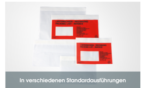
In verschiedenen Standardausführungen