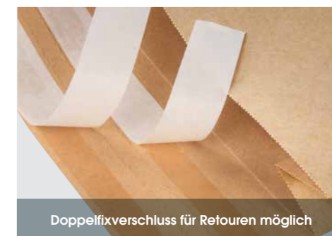
Doppelfixverschluss für Retouren möglich