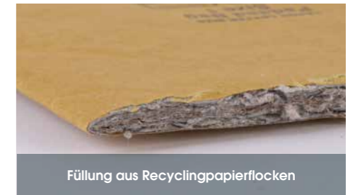
Füllung aus Recyclingpapierflocken