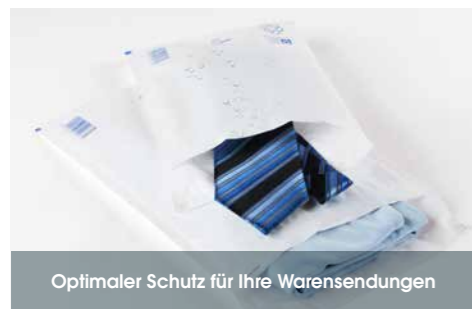
Optimaler Schutz für Ihre Warensendungen

Mit ihrer Außenlage aus blickdichtem, reißfestem Polyethylen ist unsere reißfeste und widerstandsfähige Luftpolstertasche perfekt für den extra sicheren Versand Ihrer empfindlichen Waren geeignet. Die wasserabweisende und blickdichte Variante unserer gepolsterten Versandtaschen, unsere aroFOL® poly, ist problemlos mit Kugelschreiber beschreibbar.