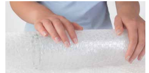
aroFOL® bubble – effektive Polsterung