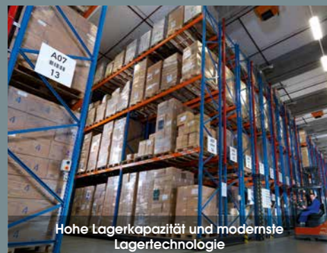
Hohe Lagerkapazität und modernste Lagertechnologie

Profitieren Sie von unserem fortschrittlichen Lagersystem. Durch hohe Lagerkapazitäten und modernste Lagertechnologie können wir Ihnen eine sowohl sichere als auch schnelle Verladung und somit eine kurzfristige Auslieferung unseres Standardsortiments bieten.