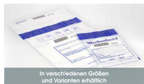
In verschiedenen Größen und Varianten erhältlich