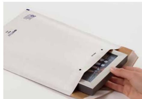
aroFOL® plus mit extra starker Außenlage

Die „Starke“ unter den Luftpolsterversandtaschen