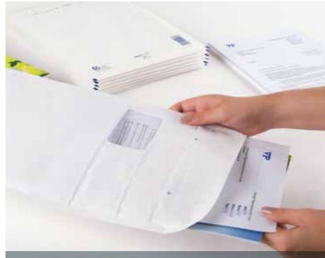
Bewährter aroFOL®-Schutz mit Sichtfenster

Die Luftpolsterversandtasche mit Durchblick