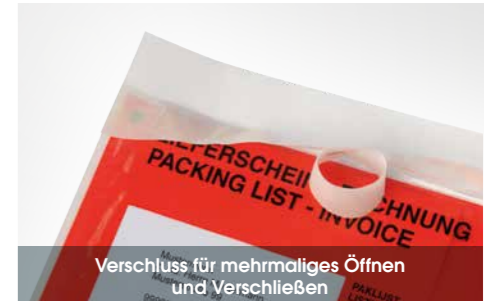
Verschluss für mehrmaliges Öffnen und Verschließen