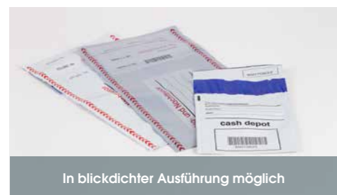
In blickdichter Ausführung möglich

Sie möchten Geld oder Wertgegenstände sicher transportieren? Unsere Sicherheitstasche docuCARE® plus macht Manipulationsversuche durch den Einsatz unseres blauen Sicherheitsklebbandes sichtbar, indem ein versteckter Schriftzug ausgelöst wird. Das breite Lagersortiment aus klimaneutraler Produktion bietet weitere Sicherheitsmerkmale und eignet sich durch vielseitige Ausführungen für die unterschiedlichsten Einsatzbereiche. Serielle Codierung mit Code 39 oder GS1-128 (CashEDI).